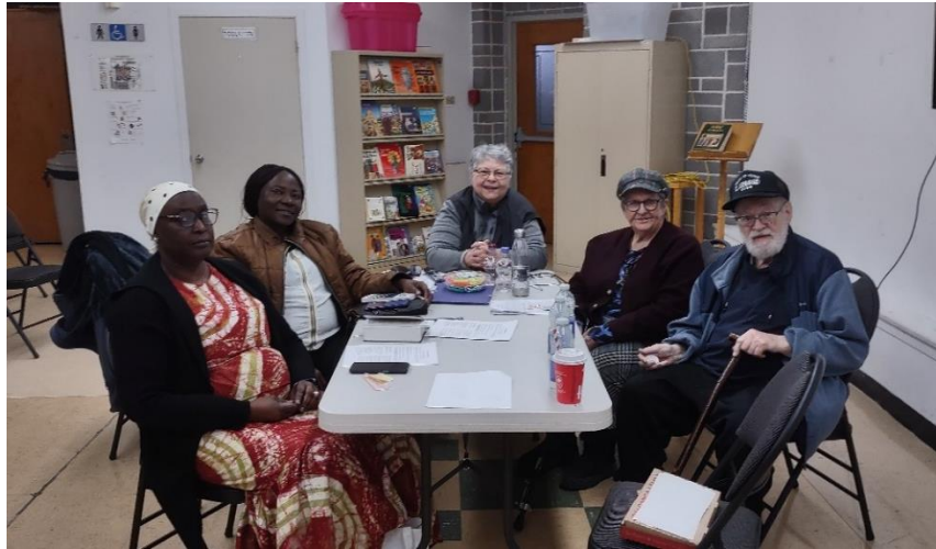
le 17 avril 2026

Ces groupes se rencontrent au sous-sol de l'église Saint-Laurent. Ce lieu a d'ailleurs accueilli un congrès régional des Volontaires de Dieu le 13 septembre 2025. Une quarantaine de personnes ont alors assisté à cet événement.