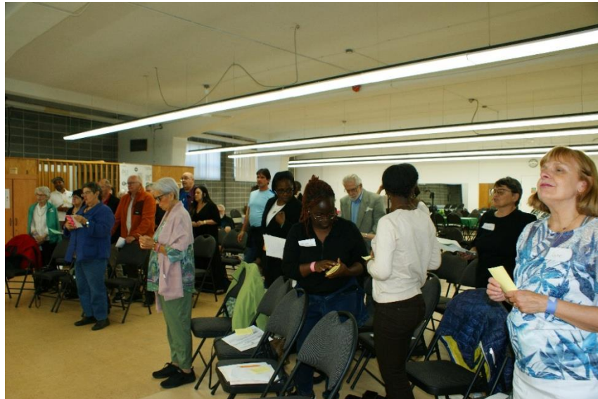
Congrès régional des Volontaires de Dieu, 13 septembre 2025

Ces groupes se rencontrent au sous-sol de l'église Saint-Laurent. Ce lieu a d'ailleurs accueilli un congrès régional des Volontaires de Dieu le 13 septembre 2025. Une quarantaine de personnes ont alors assisté à cet événement.